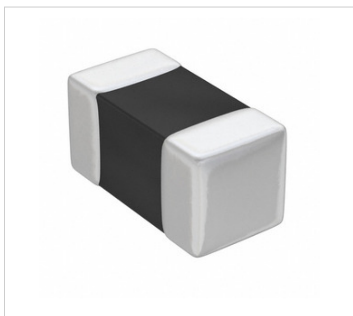
Kuva voi olla edustus. Katso tuotetiedot.